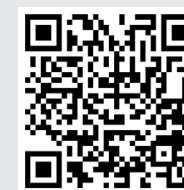
Cours Hebdo Ados ↑