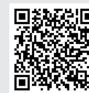
LabO des ADOS ↑